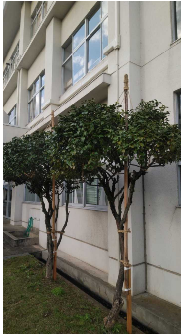
生徒玄関横駐車場のユキツバキ