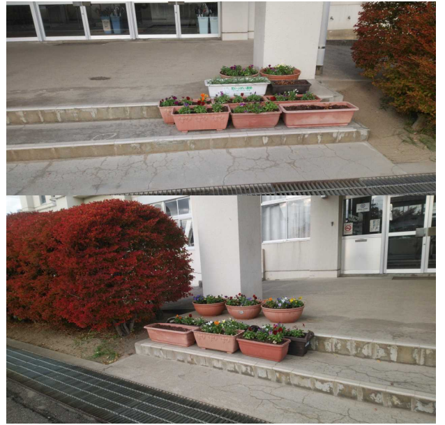
玄関の階段にプランター