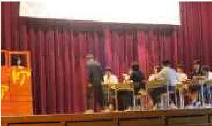
演劇「Time Waits For No One」

様々な場面で生徒一人一人が主役になり、輝く白嶺祭でした。合唱、作品展示や発表、演劇などの様々な芸術が阿賀津川中学校を彩り、素晴らしい1日になりました。ご来賓の皆様、保護者・地域の方々、本当にありがとうございました。