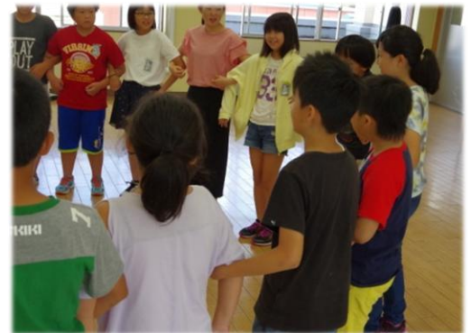
わくわくに向けてリーダー会議・高学年

今年の秋のわくわくチャレンジは、昨年と同様の 殿様街道～赤崎山入口～角神湖畔青少年旅行村 のコースで行われます。自然観察ビンゴゲームなどをしながら、阿賀町の豊かな自然の中を縦割り班で励まし合いながらゴールを目指します。沿道の、秋の草花や木の実に親しみながら、なかよし班のつながりも深めていければと思います。ボランティアと一緒に歩いてくださる保護者の皆様、どうぞよろしくお願いいたします。