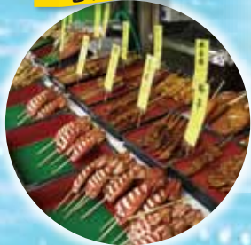
日本海でとれた 名物 浜焼き