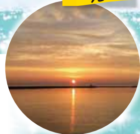
日本海に沈む夕日