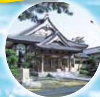
良寛様ゆかりの地 照明寺