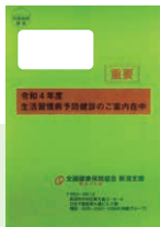
生活習慣病 予防健診のご案内