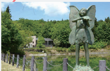
(星と森の詩美術館)