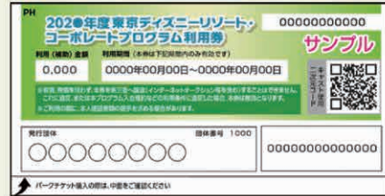
コーポレートプログラム利用券

利用券に記載されている利用(補助)金額分が、パークチケット価格や ディズニーホテル宿泊費から差し引かれる形でご利用できます。