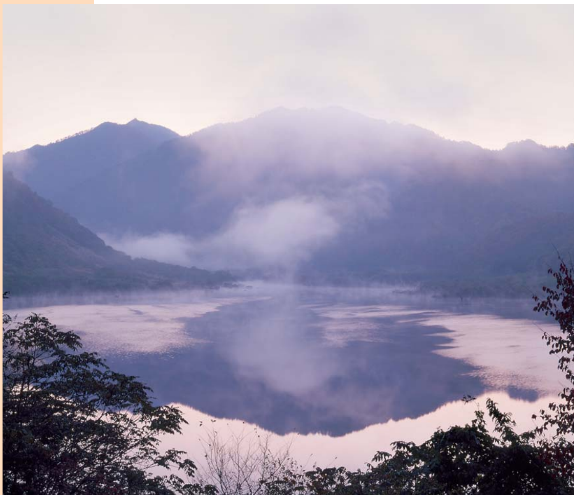
水のある風景 ▲奥三面川〈朝日村〉