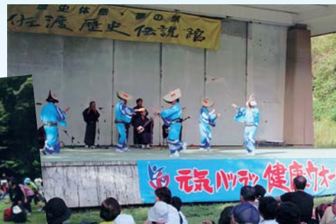
さざなみ会のアトラクション