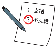
賞与支払届総括表

賞与支払予定月の前月に、被保険者の氏名・生年月日などの基本情報を印字した届書用紙が送付されますので、必要事項を記入のうえ提出してください。