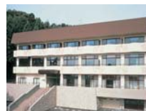
グリーンヒル山彦