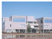
社会保険長岡健康管理センター