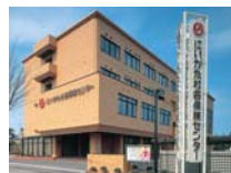
にいがた社会保険センター