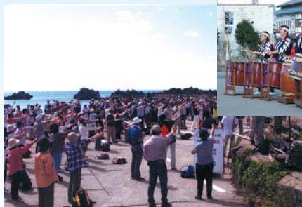
御番所太鼓の演奏