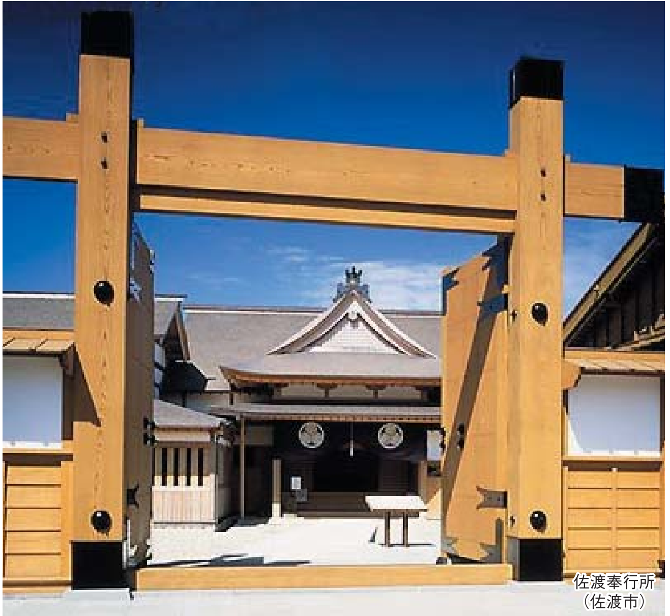
佐渡奉行所 (佐渡市)