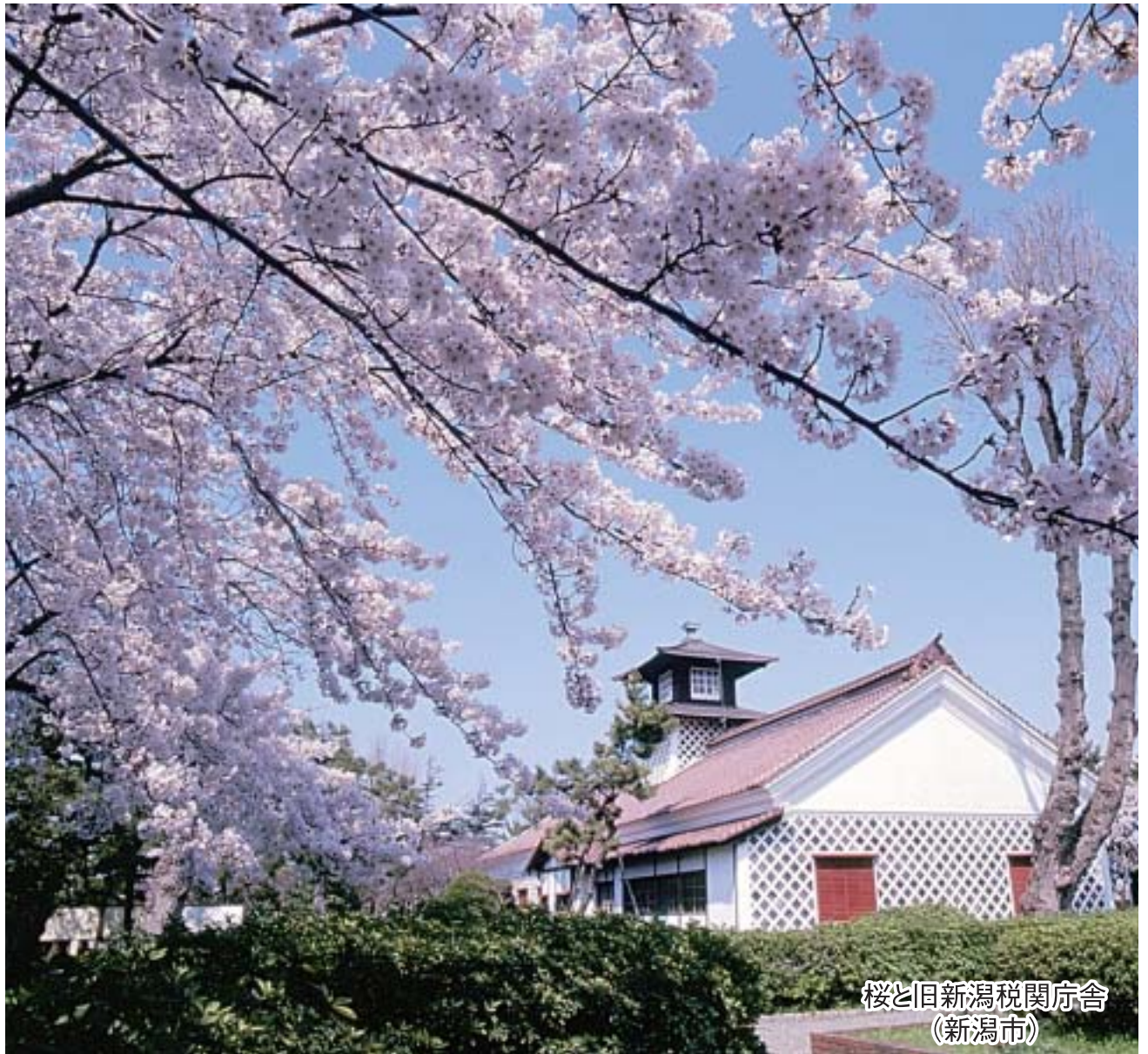
桜と旧新潟税関庁舎 (新潟市)