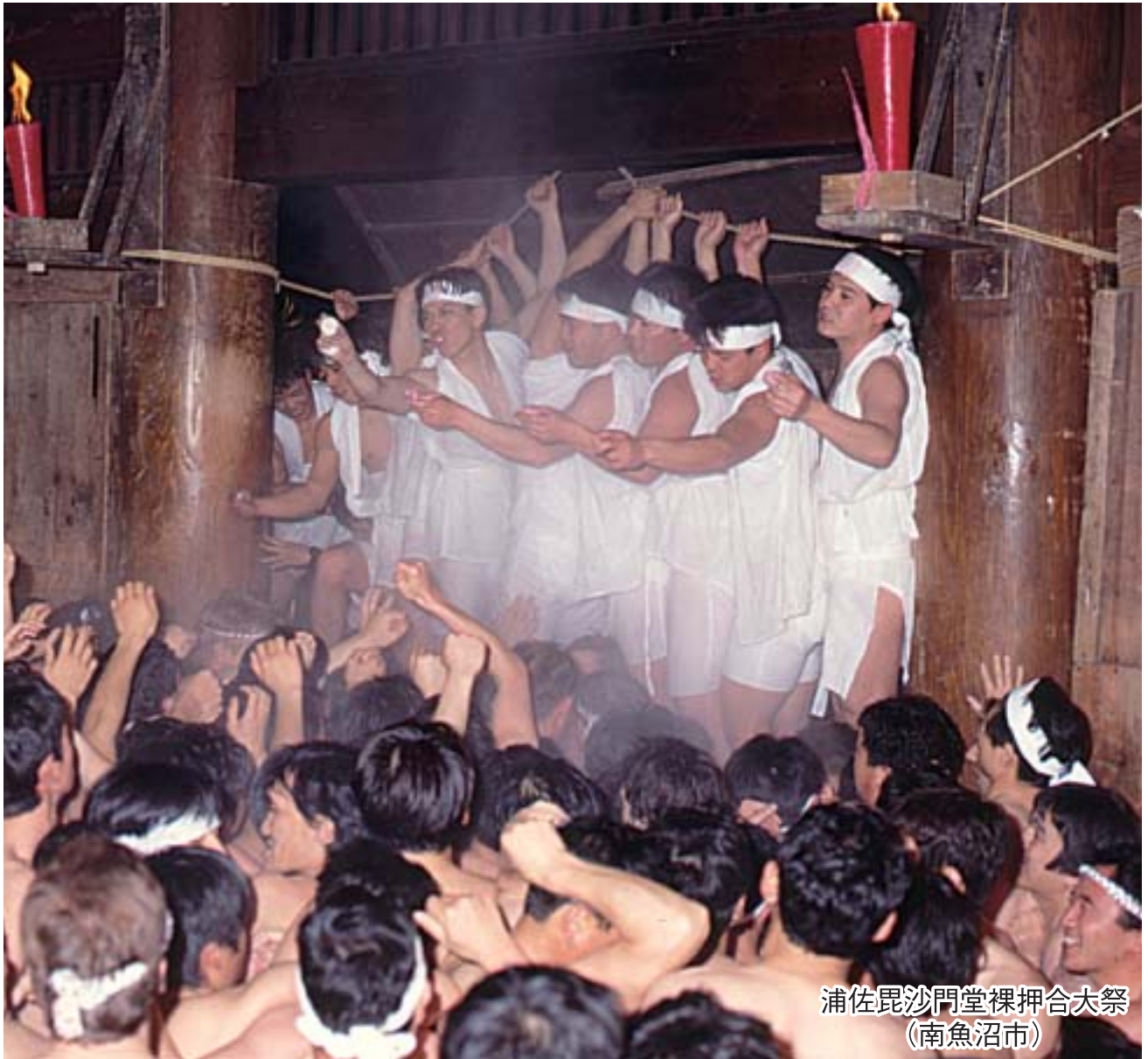
浦佐毘沙門堂裸押合大祭 (南魚沼市)