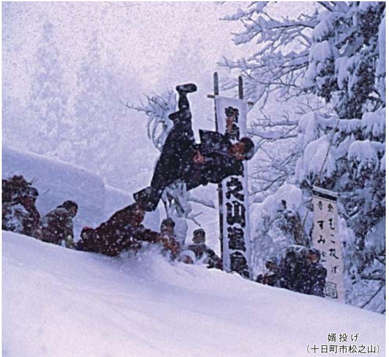
婿投げ (十日町市松之山)