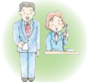
会社員・公務員など