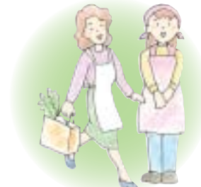
第2号被保険者に扶養されている配偶者（年収130万円未満など、一定の要件を満たす方）

20歳になったときや退職などで国民年金の加入種別が変わったとき、第2号被保険者以外の人は自分で手続きが必要です。