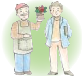
農林漁業者・自営業者・学生など