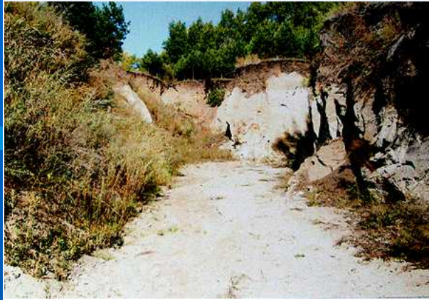
事業実施前の浸蝕溝