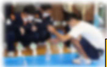
「学び合い」による深い学び