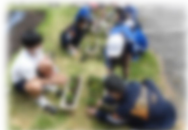
小中フラワーガーデン