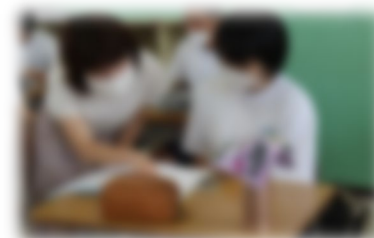
阿賀黎明学舎学習会