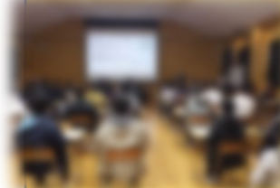
レジリエンス講習会