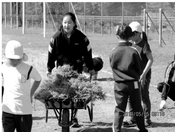
小学生が取った草を集める中学生

朝早くから、たくさんの保護者の皆様からお集まりいただき、学校の除草作業を行いました。1時間余りの作業でしたが、大変きれいに校庭が整備され、子どもたちもうれしそうでした。中でも、私が感心したのは、中学生が本当によく働いていることです。自分から率先して動き、小学生にも声をかけ、誰一人手を抜いていないのです。その姿を見て、小学生も一生懸命働いています。こうした伝統的な小中のつながりが、いつまでも続くことを願っています。本当に素晴らしい中学生たちです。