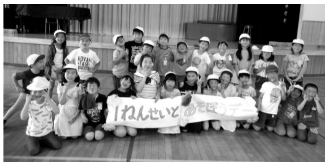
仲良く記念撮影（1年生と3年生）

運営委員会が呼びかけ、お昼休みに各学年が1年生と一緒に遊ぶことになりました。手つなぎおにや、リレーなど、1年生といっしょに遊ぶことを通して、2年生以上は1年生を思いやることができるようになり、1年生は2年生以上の子どもたちをより身近に感じることができるようになりました。