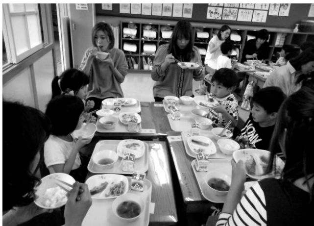
1年生、いつもしっかり食べています

一年生の保護者を対象に、給食試食会を実施しました。13人の保護者の方からご参加いただき、子どもたちと一緒に給食を食べていただきました。同日行われた学年懇談会では、「食べる量を自分で調整できることがわかって安心した。」等の感想をいただきました。食べ物の好き嫌いほどの子にもあると思われませんが、苦手なものでも、口にしてみるのが大切です。偏りなくいろいろな食材を食べることを、小さいうちから身に付けてほしいです。