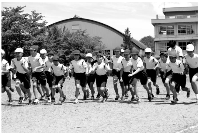
5, 6年生 一斉にスタート!

今年、「全校でグラウンド5000周」というめあてを設定し、毎日の走り込みを行いました。その成果を一人一人が、記録会で存分に発揮することができました。